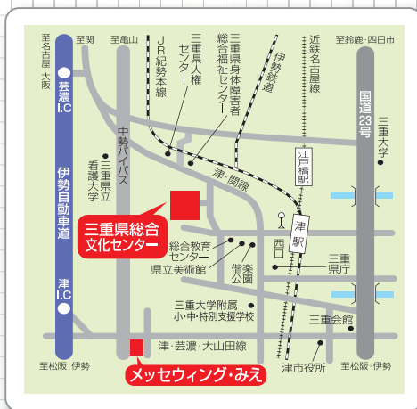
メッセウイング・みえ 会場案内図