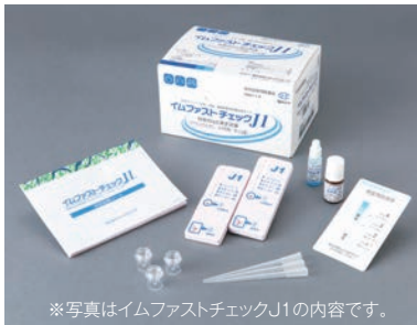
※写真はイムファストチェックJ1の内容です。